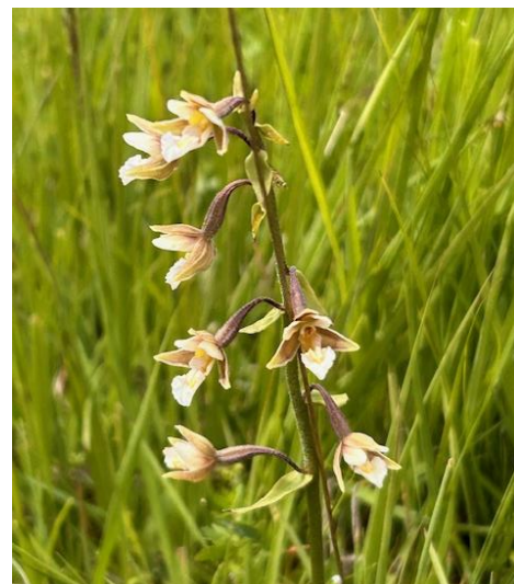
Kärknipprot, Odensholm juli 2024

Antalet betalande medlemmar år 2024 var 120 personer.