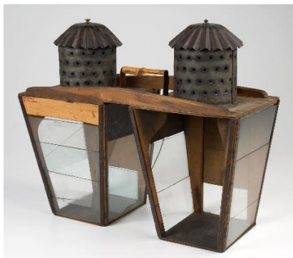
Lampor som användes vid ljustring, Fiskecenter Kalakeskus 1940, Fiskecentret startade 1938?

- Vi har skrivit om årsmötet 2024 i Kustbon nr 2, 2024. Vi har också skrivit om Sommarresan och om den nya bryggan på Odensholm, i Kustbon nr 3, 2024.