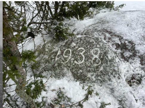
Stenen i Storhamne som kan betyda att