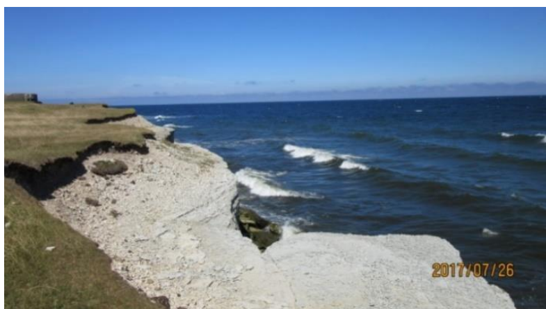
Foton: Bårevike vid fyren, Backtimjan