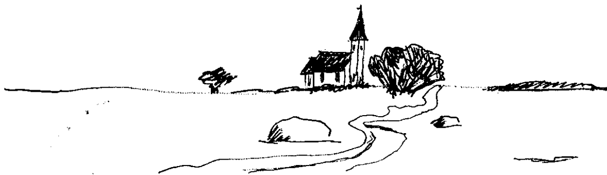
Odensholms kapell (Jesu kapell)

Jag tror nästan att prästen och klockaren och några andra dristiga gav sej ut till ön på söndagen, prästhåldsdagen, men farmor och jag stannade kvar i Spithamn i avvaktan på bättre väder. Detta infann sig redan på måndag. Det blev en underbar resa och ön var på avstånd precis som jag föreställt mej. Långt borta skymtade redan det vita kapellet och en liten rensa av den sparsamt förekommande skogen.