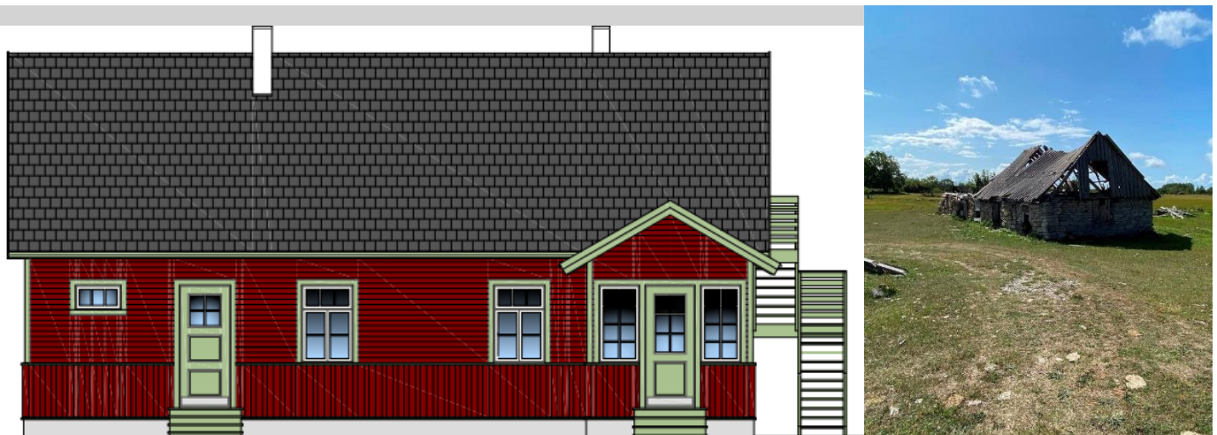
Holmbogården och Erkas tomt i Bien juli 2023.

Detta gäller förutsatt att offerten är rimlig med ett överkomligt pris, så kan avtal skrivas, och det kan vara möjligt att påbörja projektet under 2024.