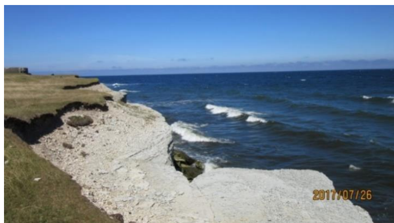
Foton: Bårevike vid fyren, Backtimjan