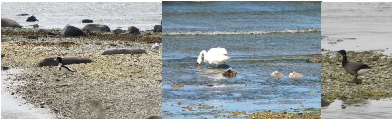
Såna Sia 2012: Gravand, Knölsvan med ungar, Mörkbukig Prutgås

I frågan om kulturarv ger MKB rekommenderade åtgärder. Om man under byggnationen finner arkeologiska föremål, människoben eller ett arkeologiskt kulturlager ska man i första hand utgå från kulturminnesskyddslagen. Man ska stoppa arbetet, bevara platsen i oförändrad form och omedelbart underrätta kulturminnesnämnden och kommunen.