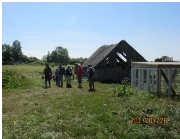
Byalagets tomt, juli 2017