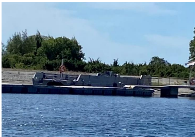
Den nya pråmen i Storhamne, augusti 2022