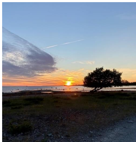
Augusti 2022: Såna Sia