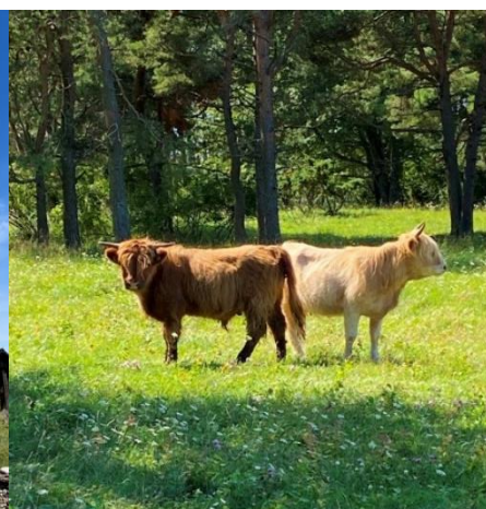
Skotsk höglandsboskap Vid Stornäskärre