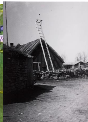
Alfred Brus Storstege