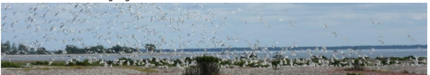
Måsar vid Hoitstainvike