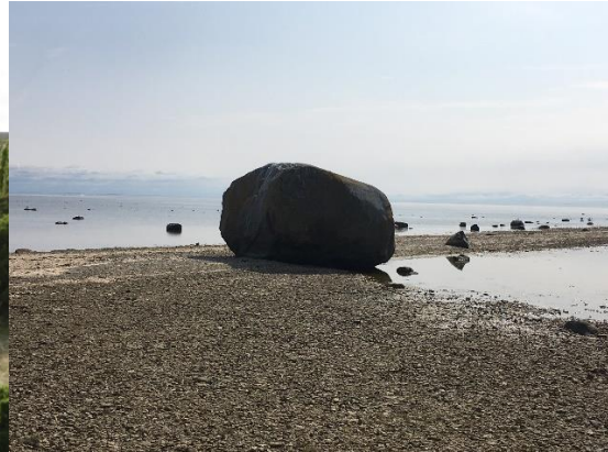
Hoit stain (?)