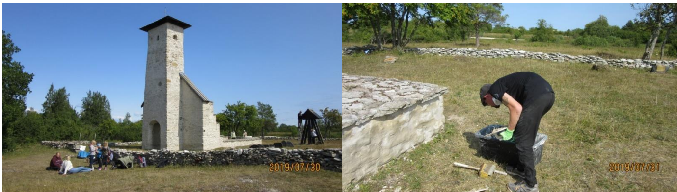
Arbete vid Kapellet