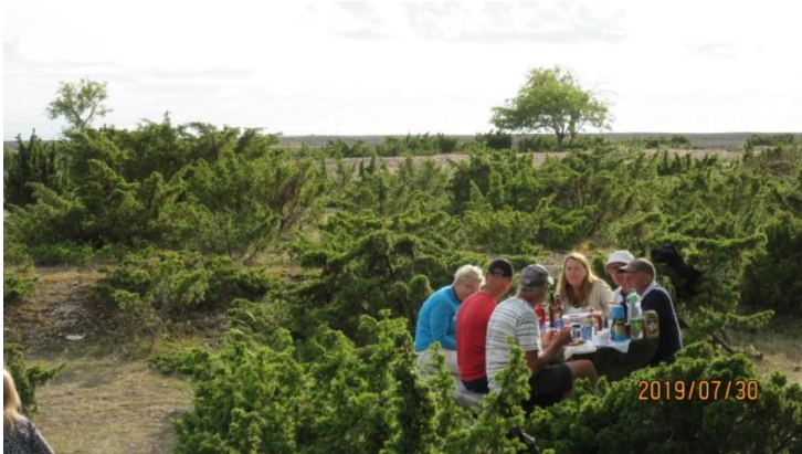
Middag vid Storhamne