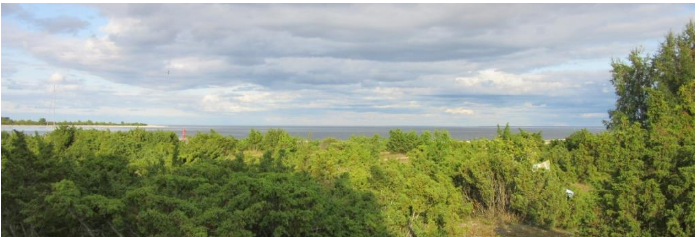
Storhamne juli 2019

Antalet betalande medlemmar 2019 uppgår till 120 personer.