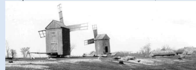
Koinbackan och Bien i bakgrunden