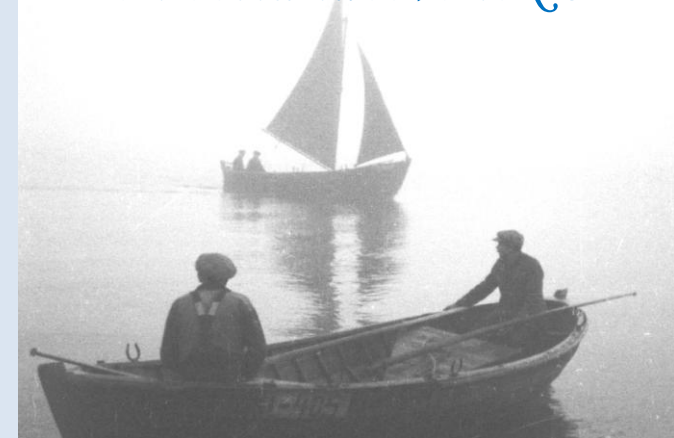
Fiske på Odensholm 1937