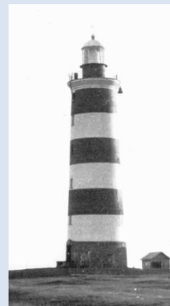
Fyren ( Måjaken ) före 1920

Genom sitt läge vid sjövägen från öst till väst kom ön tidigt att spela en roll för sjöfarten. Holmborna lotsade fartyg öster- och söderut längs Estlands kuster. Den första fyren öppnas år 1765 och 1850 färdigställs den fyr av sten som stod kvar till 1941 då den förstördes fullständigt av de retirerade sovjetiska trupperna. Holmborna kallade fyren Måjaken . Fyren och kapellet utgjorde under lång tid viktiga sjömärken. På ön fanns också en sjöräddningsstation, med en räddningsbåt av typen six-oar whaler , som bemannades av holmborna.