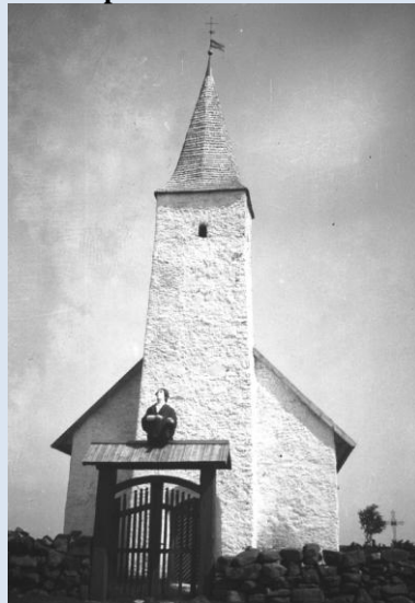
Jesu Kapell 1932, foto Eesti Filmiarhiiv, EFA 1-8814

På 1500-talet byggdes ett träkapell på ön, sannolikt på samma plats som nuvarande Jesu Kapell. Redan under högmedeltiden fanns troligen ett enkelt träkapell på Odenholm. Jesu kapell byggdes år 1765-1766 av kalksten från ön. Det hade måtten 12 x 7 meter med ett 10 meter högt torn, som syntes vida över havet. Kyrkogårdsporten var byggd av ekstockar från ett gammalt vrak. Bysten föreställande