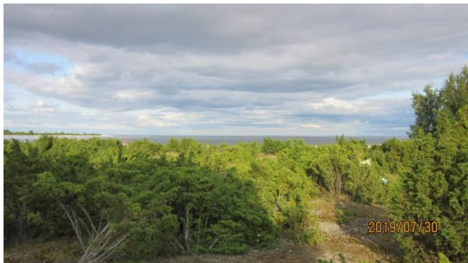
Boan, utsikt mot Storhamne