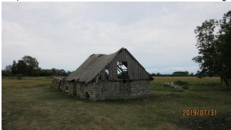
Byalagets tomt med Erkas gamla ladugård