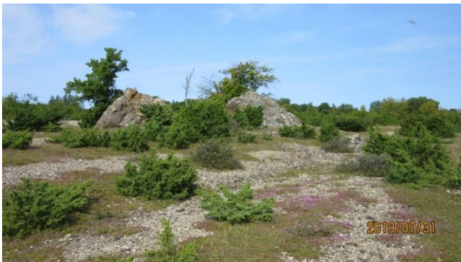
Tvillingarna vid Pålande (av brecciagranit från Nygrund)