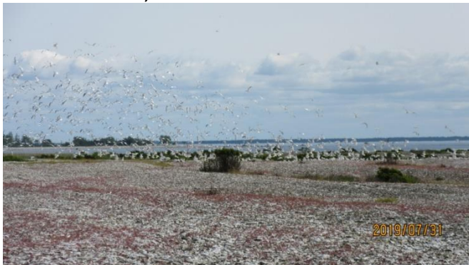
Måsar vid Hoitstainskåtan, Västa sia