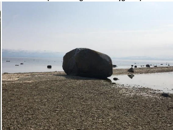
Hoitstain, Sånna sia