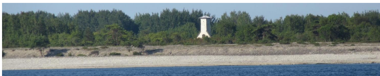
Kapellet sett från havet norrifrån