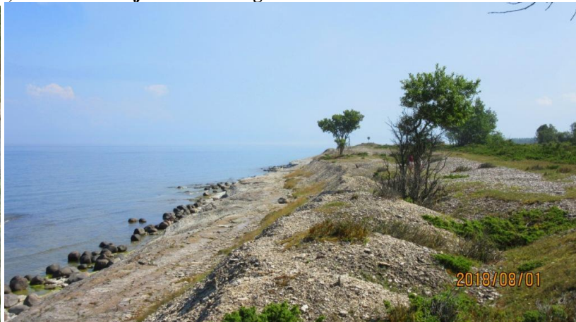
Foton från juli, augusti 2018: Ägretthägrar i Lihlhamne, Norda Sia