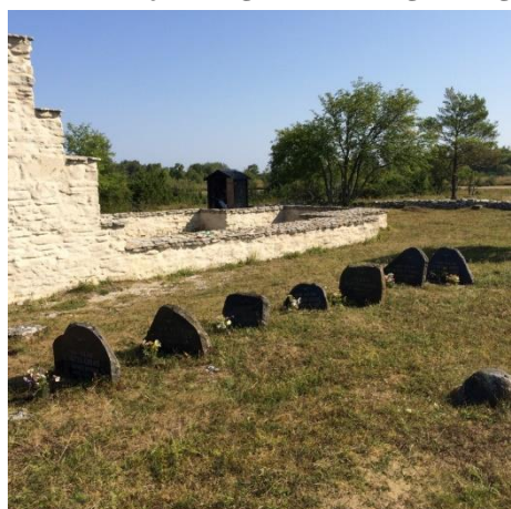
Gravgården juli 2018