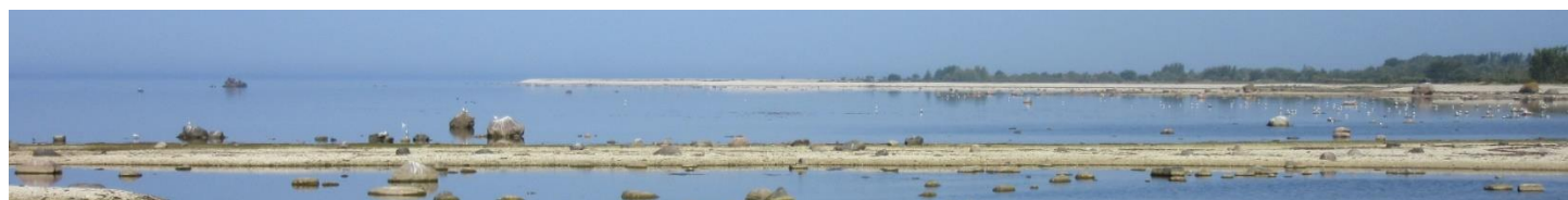
Såna sia i juli 2018