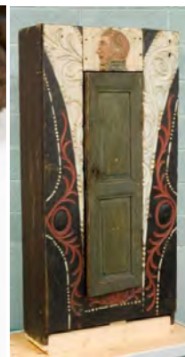
Torskfiskebåtarna 1926, foto SOV:s bildarkiv. Sälharpun av äldre modell och skåp fr Marks från Eesti Rahva Muuseum, Tartu