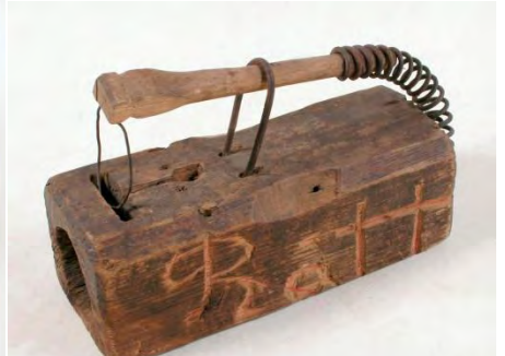
Föremål från Eesti Tahva Muuseum i Tartu, insamlade vid tvångsevakueringen juni 1940., foton ERM