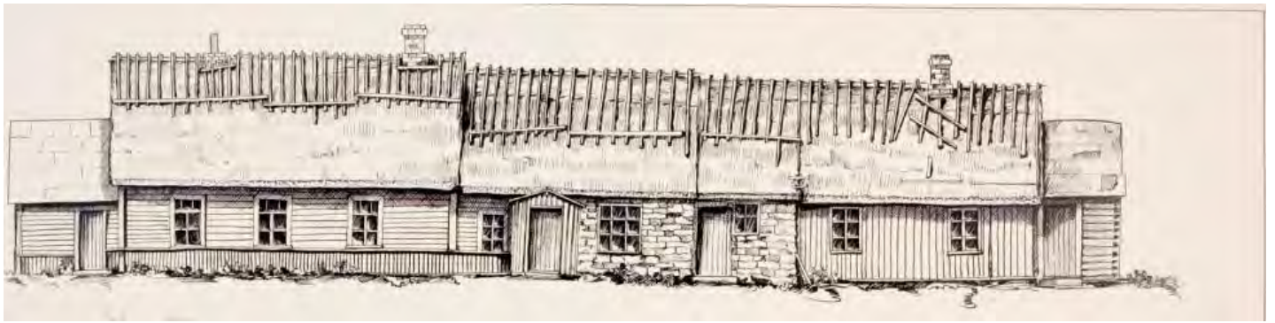
Eesti Rahva Muuseum 7139:11, Teckning av Julius Brus gård, Esko Lepp 1940