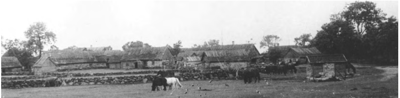
Bien: Erkas gatna, Erkas gård och Niggorsgården.